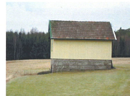
Spannmålsbod från 1930-talet, Strömstad

Evert Taube, Inbjudan till Bohuslän 1943