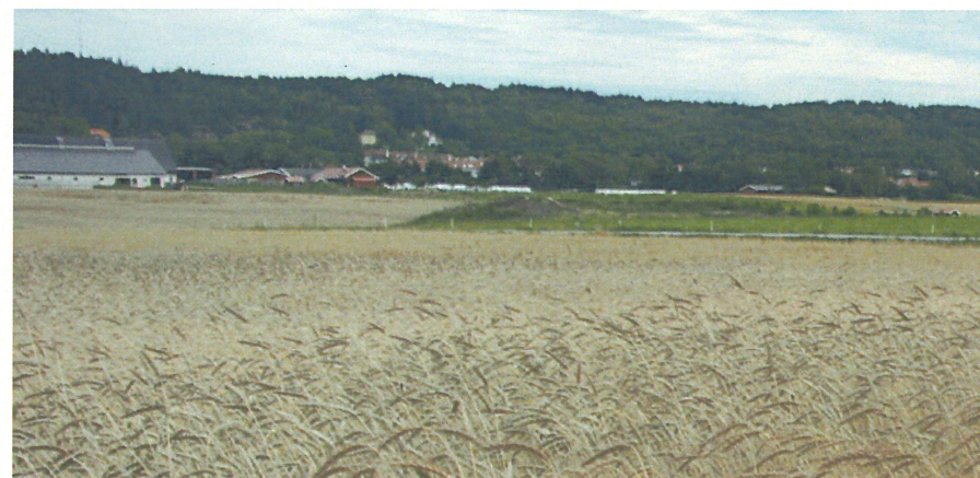
Demonstrationsodling av Speltvete på Dingle Naturbruksgymnasium