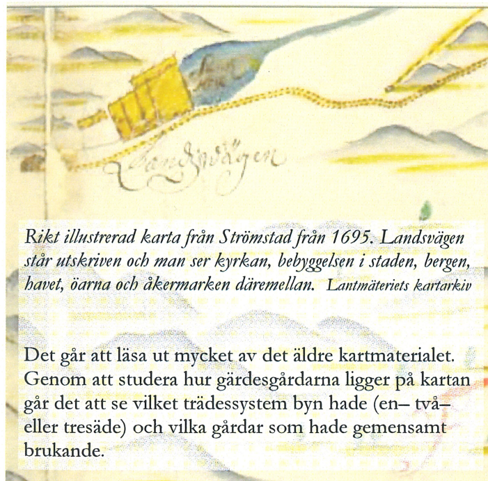
Riket illustrerad karta från Strömstad från 1695. Landsvägen står utskrivet och man ser kyrkan, bebyggelsen i staden, bergen, havet, öarna och åkermarken däremellan. Lantmäteriets kartarkiv

Under 1800-talets första hälft fick jordbruket ett kraftigt uppsving tack vare en ökad export av havre. Detta var särskilt märkbart i delar av Dalsland där havreodlingen kom att påverka hela bygden. Bönderna fick det bättre ställt och investerade sitt kapital bland annat i nya byggnader, de så kallade dalslandsstugorna uppfördes under denna period. Havren gick på export till London och dess hästdragna droskor. Järnvägen mellan Uddevalla och Borås gick under namnet Havrebanan.