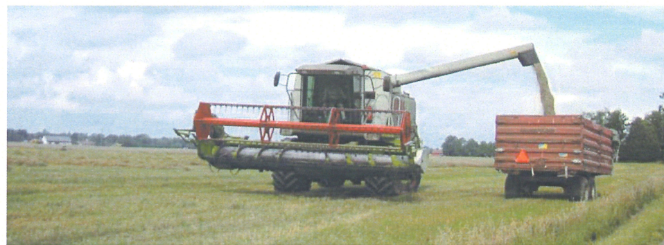
Tröska mitt i skörden utmed väg E45 i Dalsland

Jordbruket i stort genomgick en stor förändring från och med mitten av 1700-talet och är fortfarande under ständig omvandling. Perioden 1750 - 1870 brukar kallas för ”den agrara revolutionen”. Under denna period genomfördes skiftena då byarna sprängdes och det blev ensamgårdar. Mycket teknisk utveckling skedde också och en början till mekanisering av jordbruket. Många leriga slättbygder odlades upp och är idag de bördigaste områden. Tack vare täckdikningen som gjorde att förut obrukbara marker kunde odlas präglas området runt Dalboslätten än i idag av jordbruk och livsmedelsindustri.